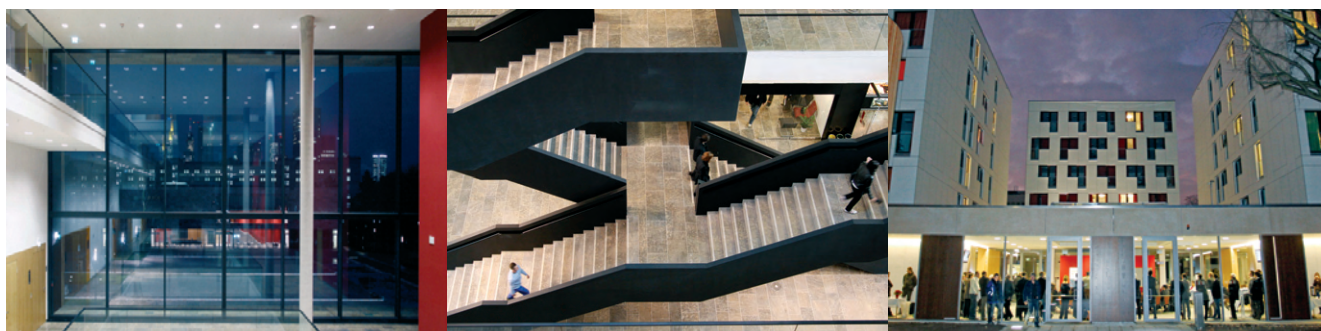
Von links nach rechts: Blick aus dem neuen Hörsaalgebäude auf das IG Hochhaus; Treppen im neuen Hörsaalgebäude; Studentenwohnheim der evangelischen und der katholischen Hochschulgemeinden.

www.uni-frankfurt.de/ueber/campi/westend/ausbau/index.html